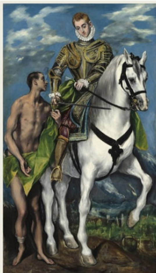
San Martino di Tours - Dipinto di El Greco (Candia, 1541 - Toledo, 7 aprile 1614)