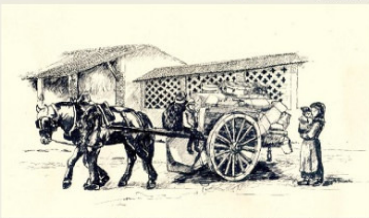
I Comuni aggregati a Milano nel 1923 ed il triste traslado di una Famiglia Contadina a fine contratto, nel giorno di San Martino (disegno di Angelo Bianchi)

Autobus 67 (M1 - Bande Nere), 63 (M1 - Bisceglie), 78 (M1 - Bisceglie e M5 - San Siro), 49 (M1 - Inganni e M5 - San Siro)