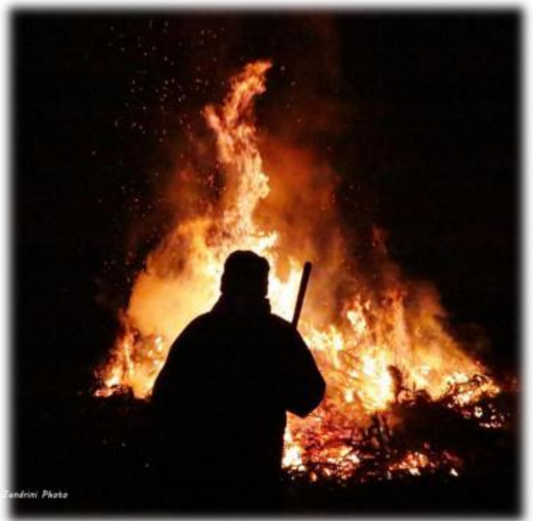
Falò Linterno – 19 Gennaio 2013 - La Catasta in Fiamme

Sant'Antonio Abate è il Protettore degli Animali ed è una figura molto venerata nel milanese.