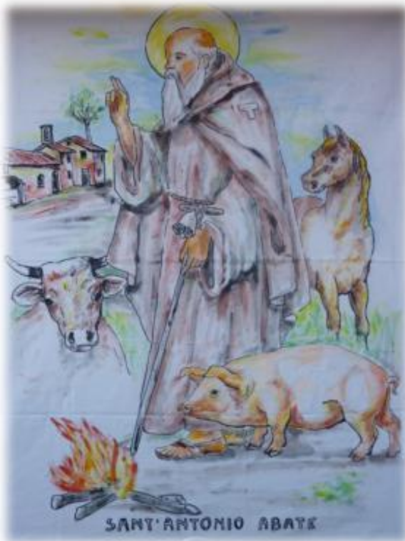
Sant'Antonio Abate o del Porcell – Opera di Angelo Bianchi

Autobus 67 da MM1 "Bande Nere", 49 da MM1 "Inganni" e 63 e 78 da MM1 "Bisceglie"