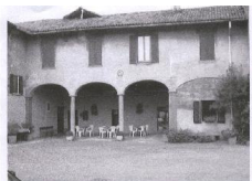
CASCINA CAVRIANO - tel. 02 76119052 VIA CAVRIANA 51 - MILANO

Cascina Linterno, Quarto Cagnino e Parco delle Cave Al mattino, rievocazione storica lungo Via F.lli Zoia e nel borgo di Quarto Cagnino; alla sera, passeggiata nel Parco delle Cave alla riscoperta delle lucciole. A cura degli Amici Cascina Linterno. Info: 334 7381384 22 maggio 2010 - ore 10 (corteo) e ore 21 (passeggiata)